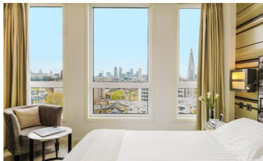
HABITACIÓN DOBLE CON VISTAS A LA CIUDAD