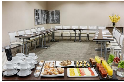
SALÓN OXFORD CIRCUS