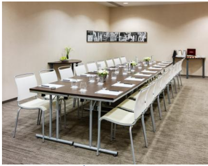
SALÓN MARBLE ARCH