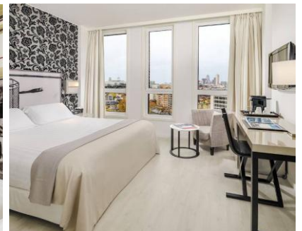
HABITACIÓN DOBLE DELUXE