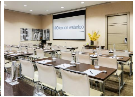
SALÓN OXFORD CIRCUS