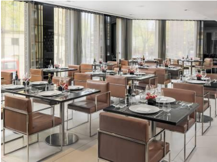
RESTAURANTE THREE O TWO

Circus Lounge: una selecta carta de cocktails para disfrutar de una agradable velada