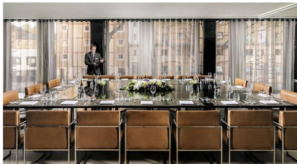
BANQUETE EN EL RESTAURANTE THREE O TWO

En el H10 London Waterloo cuidamos todos los detalles para que su celebración se convierta en aquello en lo que siempre había soñado. El hotel cuenta con un experto equipo de profesionales y ofrece una cuidada gastronomía de autor que sorprenderá a los paladares más exigentes.