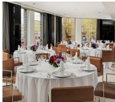
BANQUETE EN EL RESTAURANTE THREE O TWO