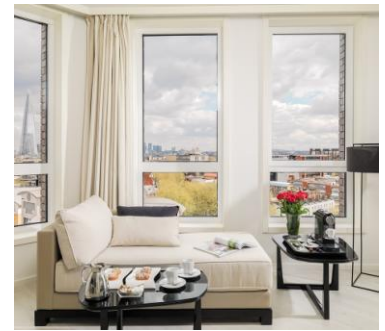
DETALLE DIVÁN WATERLOO SUITE