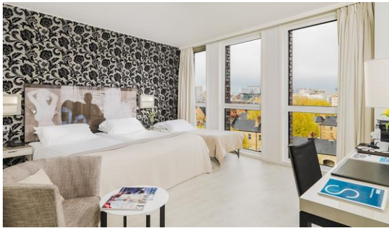
HABITACIÓN TRIPLE CON CAMA SUPLETORIA