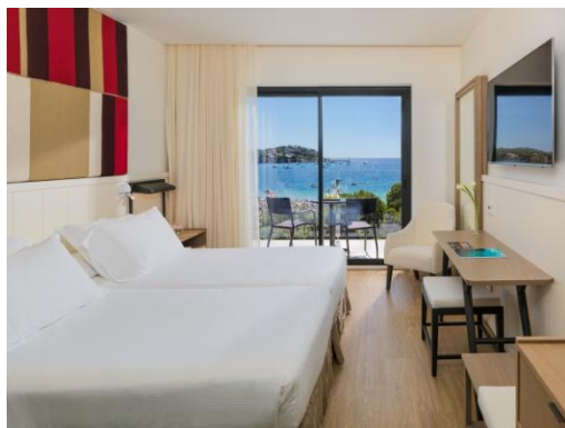
HABITACIÓN DOBLE SUPERIOR VISTA FRONTAL MAR

Habitaciones Dobles: habitaciones de 22 m 2 renovadas en 2016. Pueden disponer de vistas al patio interior o también, con suplemento, a la calle o a la piscina.