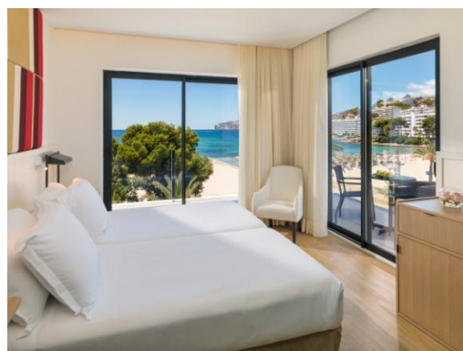
HABITACIÓN THE CORNER

Opción de habitaciones con vistas a la piscina o laterales al mar y también habitaciones con vistas frontales al mar (con suplemento).