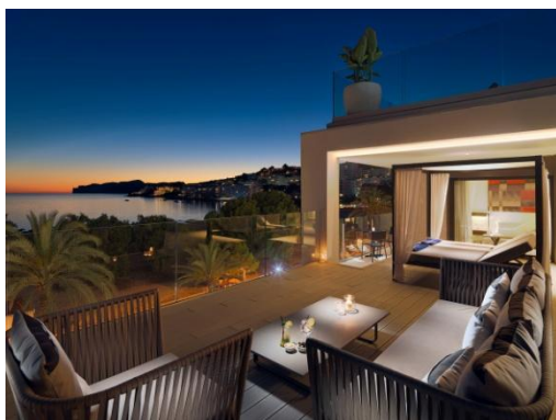
TERRAZA HABITACIÓN THE QUEEN

Habitación The Queen: la estancia más exclusiva del hotel. Una Habitación Doble Superior que incorpora una espectacular terraza de 50 m 2 con cama balinesa y sofá con vistas privilegiadas a la bahía de Santa Ponça. Cuenta también con una ducha exterior.