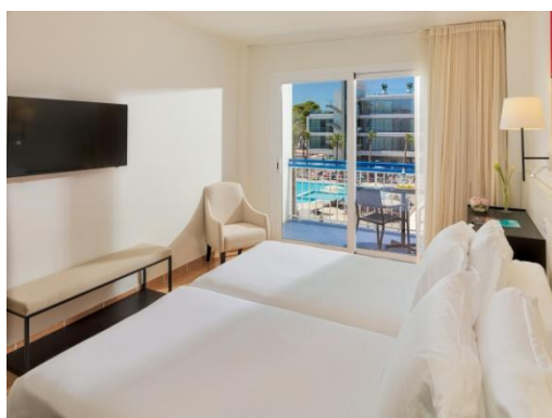
HABITACIÓN DOBLE VISTA PISCINA

Habitaciones Dobles: habitaciones de 22 m 2 renovadas en 2016. Pueden disponer de vistas al patio interior o también, con suplemento, a la calle o a la piscina.