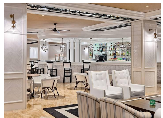
DRY BLUE BAR