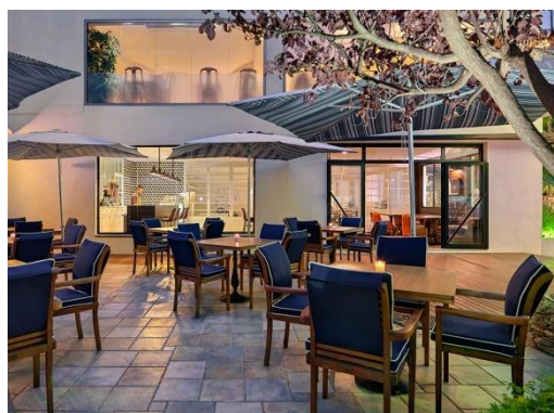
TERRAZA MIKE'S COFFEE