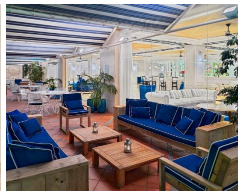
TERRAZA DRY BLUE BAR