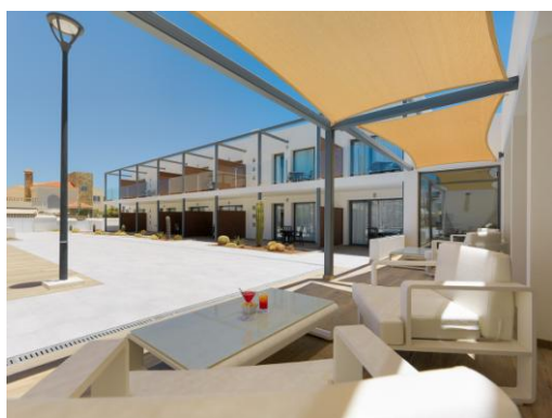
TERRAZA BAR TRAGALUZ

Bar Tragaluz: situado en el lobby del hotel. Ideal para disfrutar de una velada amenizada con música por las noches (según temporada).