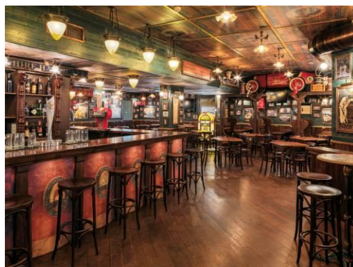
SPORTS LEGENDS TAVERN

Bar Piscina: servicio de snacks y bebidas junto a la piscina.