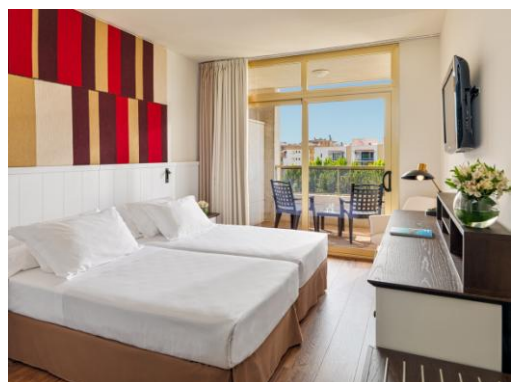
HABITACIÓN DOBLE SUPERIOR

Habitaciones Dobles: confortables y luminosas habitaciones que pueden disponer de una cama de matrimonio o dos camas individuales y acomodar hasta 2 adultos + 1 niño. Posibilidad de Habitaciones Dobles con vistas a la piscina ($).