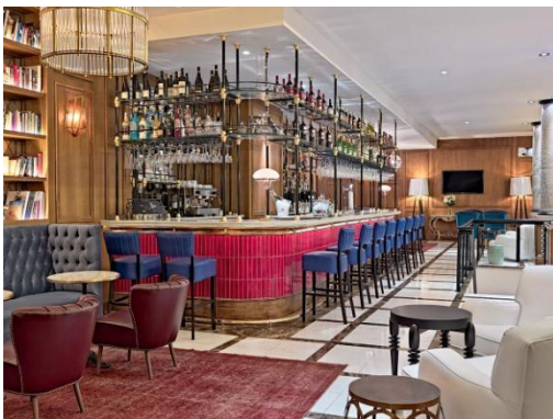
BAR LA VILLA

Restaurante Las Infantas (¡RENOVADO!): con un diseño muy actual que recuerda una cocina particular, este espacioso restaurante ofrece al cliente un completo desayuno compuesto por más de 60 productos diferentes incluyendo opciones sin gluten y dietéticas.