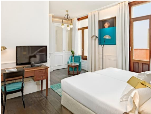
HABITACIÓN DOBLE CON TERRAZA

Habitaciones Dobles con terraza: amplias Habitaciones Dobles con una agradable terraza para disfrutar de las vistas a los sitios más emblemáticos de Madrid.