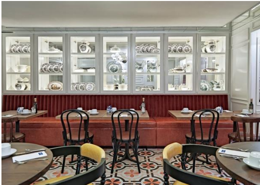
RESTAURANTE LAS INFANTAS

Restaurante Las Infantas (¡RENOVADO!): con un diseño muy actual que recuerda una cocina particular, este espacioso restaurante ofrece al cliente un completo desayuno compuesto por más de 60 productos diferentes incluyendo opciones sin gluten y dietéticas.