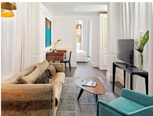
SALÓN JUNIOR SUITE

Habitaciones Superiores: cómodas habitaciones de mayores dimensiones que la Habitación Doble y equipadas con dos camas individuales y sofá-cama de 1,50m. Dispone de vistas a la Gran Vía.