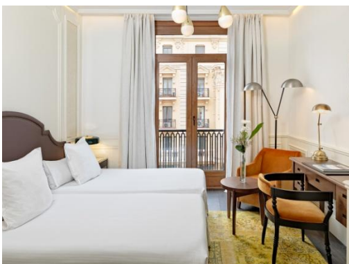
HABITACIÓN DOBLE VISTA GRAN VÍA

Habitaciones Dobles: confortables habitaciones con una decoración elegante y contemporánea. Pueden disponer de una cama de matrimonio o dos camas individuales y de vistas al atrio del hotel o a la Calle de la Reina.