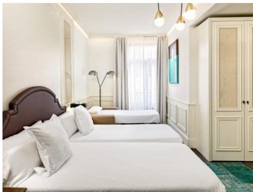
HABITACIÓN DOBLE CON SOFÁ CAMA

Habitaciones Dobles con terraza: amplias Habitaciones Dobles con una agradable terraza para disfrutar de las vistas a los sitios más emblemáticos de Madrid.